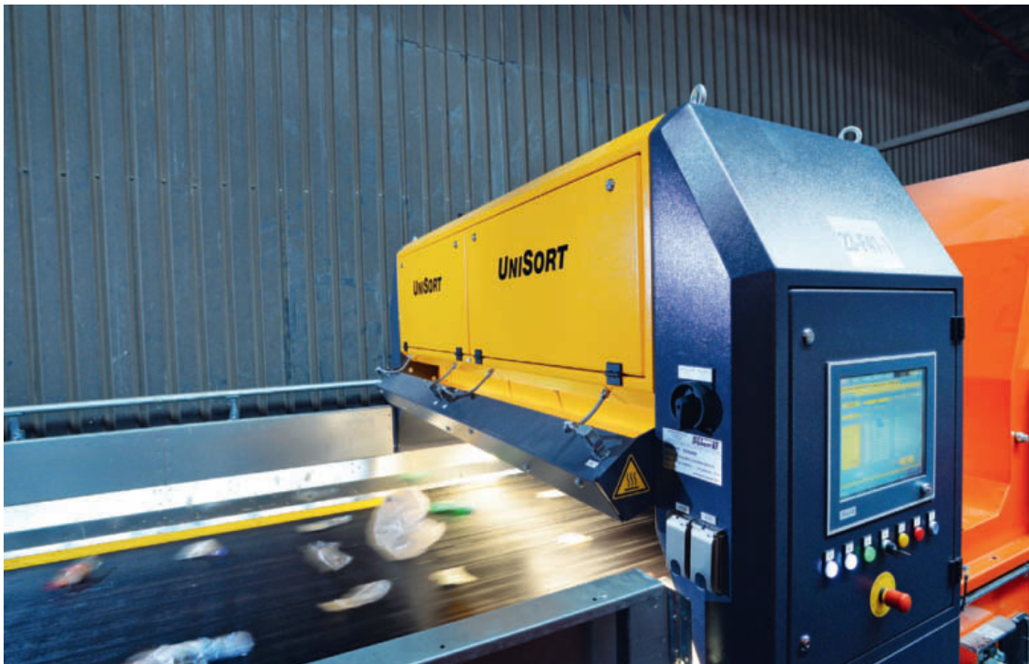
◀ The operating elements of the sensor-based sorting system